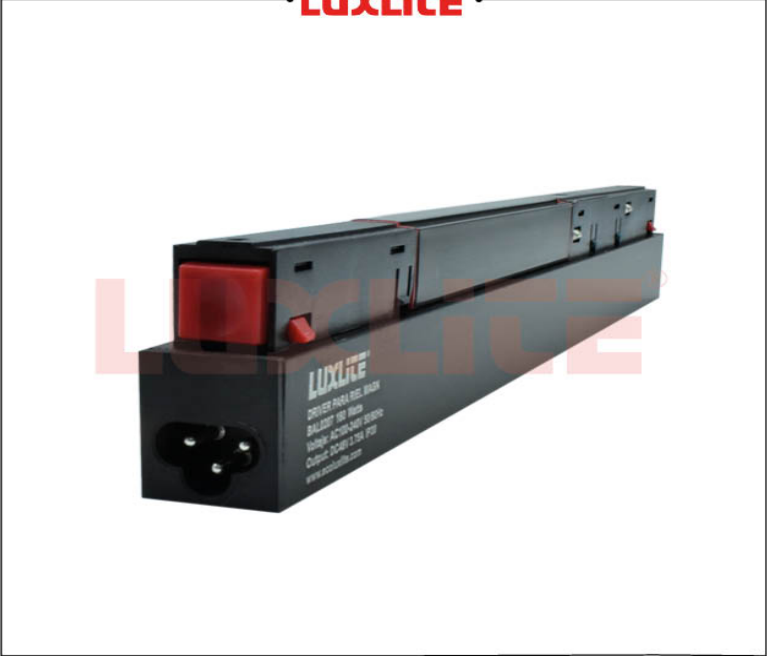
BAL0207 DRIVER 180W PARA RIEL MAGN