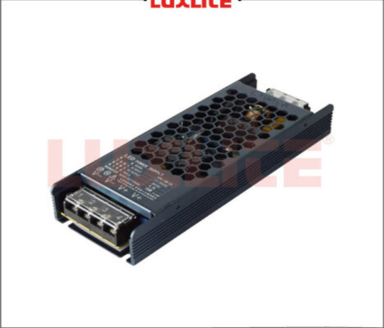
BAL0208 DRIVER 120W 24V 10MTSMAX