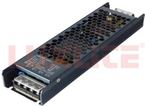
BAL0209 DRIVER 240W 24V 20MTSMAX