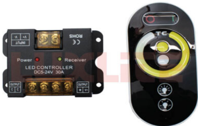
COM0242 DIMMER CCT 24V INC. CONTROL REMOTO