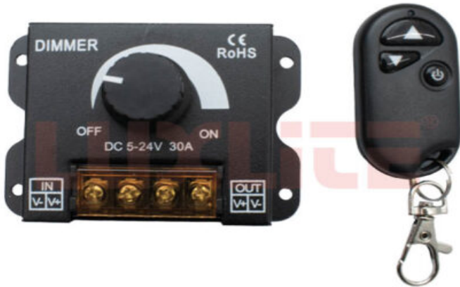
COM0243 DIMMER 24V INC. CONTROL REMOTO