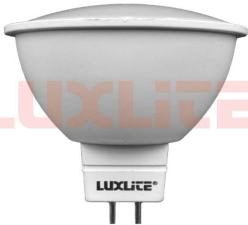
LED0044 BOMB MR16 3W 6500K A