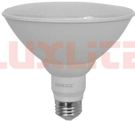
LED0052 BOMB PAR38 E26 16W 6500K A