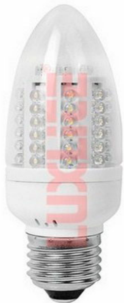
LED0111 BOMB LED C35 3W AC90-264V DL SMD