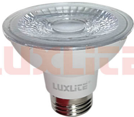
LED0131 BOMB PAR20 8W 6500K AA