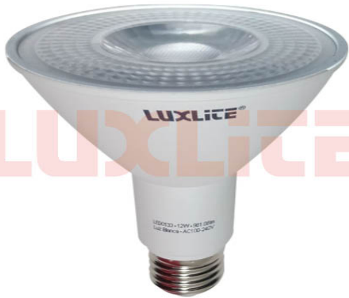
LED0133 BOMB PAR30 12W 6500K AA