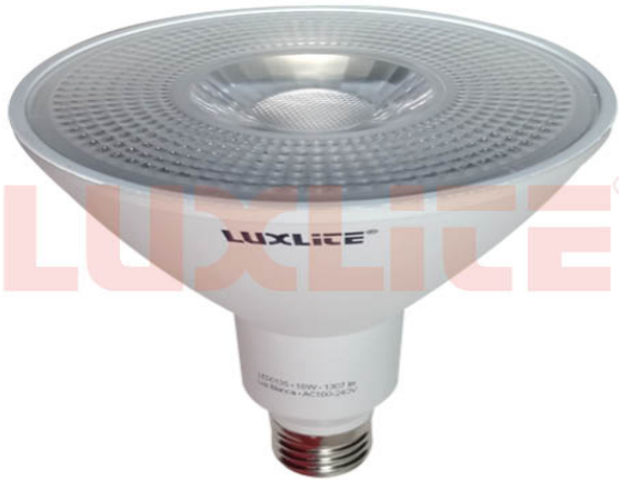
LED0136 BOMB PAR38 18W 3000K AA