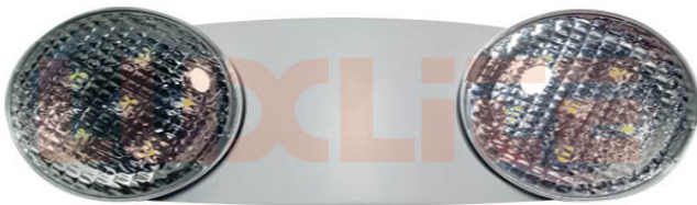
LED0165 LAMP RECHARGABLE EMERGENC 2W 6500K A