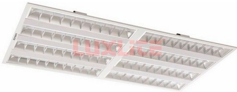
LED0179 LAMP EMPOTRAR GRID 75W 6500K AA