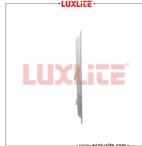
LED0424 PANEL LED DE ALUMINIO 2X4 72W 6500K