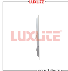
LED0424 PANEL LED DE ALUMINIO 2X4 72W 6500K