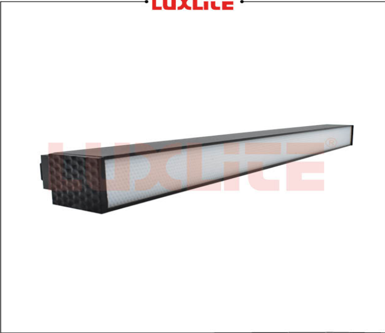
LED0489 LED LINEAL FLOOD 14W 3000K