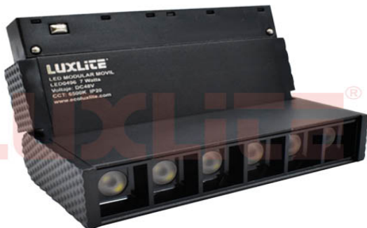
LED0496 LED MODULAR MOVIL 7W 6500K