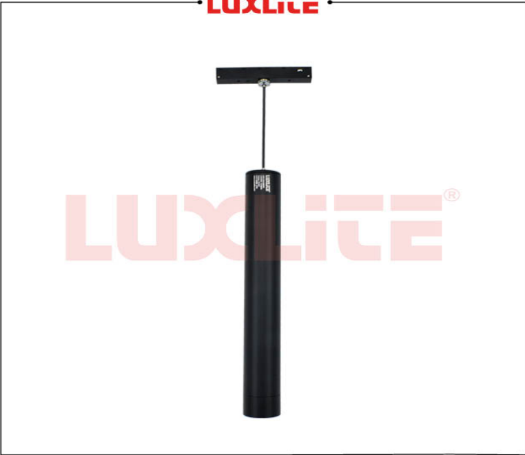
LED0501 LED COLGANTE 10W 3000K