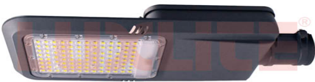
LED0502 LAMP LED ALUMB PUBLICO 100W