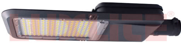
LED0503 LAMP LED ALUMB PUBLICO 150W