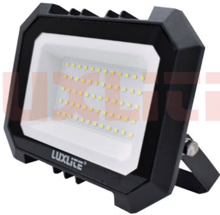
LED0504 REFLECTOR LED 50W 6500K DIF CLARO