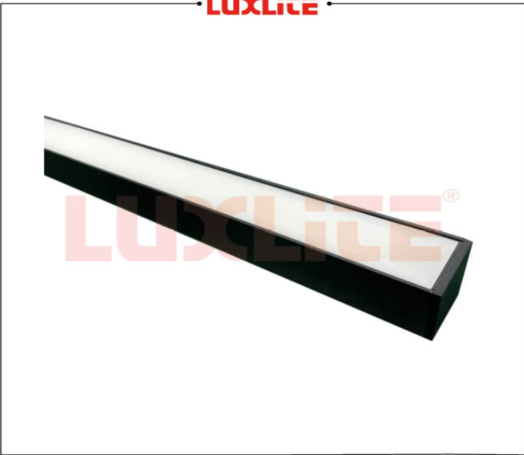
LED0508 LAMP LED LINEAL 1.2M 30W BLANCA CCT