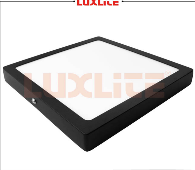
LED0512 PANEL LED CUAD. NEGR. SOBR. 24W 3000K