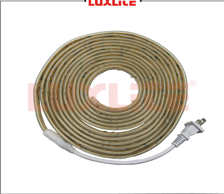
LED0520 CINTA LED 120V 15W 6500K 5MTS