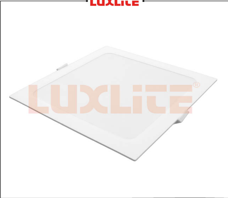
LED0538 PANEL LED CUADRADO 12W CCT