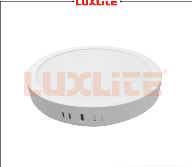
LED0543 PANEL LED REDONDO SOB 24W CCT