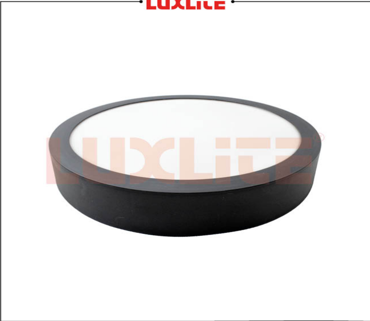
LED0544 PANEL LED NEGRO REDONDO SOB 24W CCT