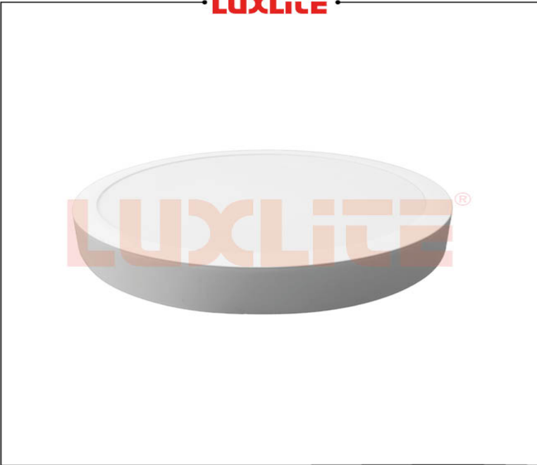
LED0545 PANEL LED REDONDO SOB 30W CCT