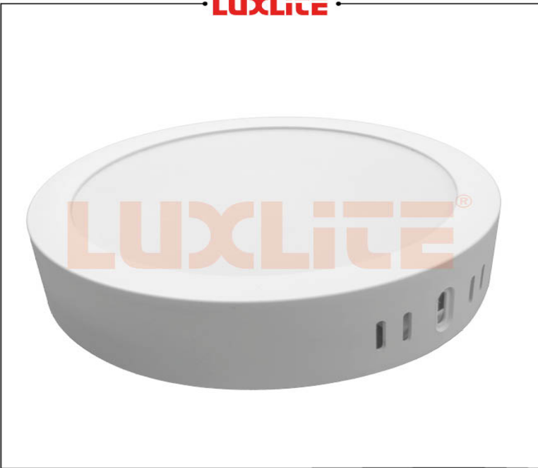
LED0547 PANEL LED REDONDO SOB 18W CCT