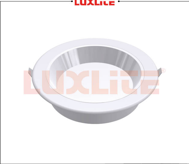
LED0552 LAMP LED 12W 6500K NO REFLEJO