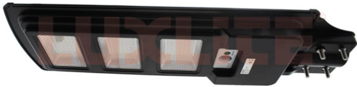
SOL0003 LAMP LED SOLAR ABS 6500K 3000LM